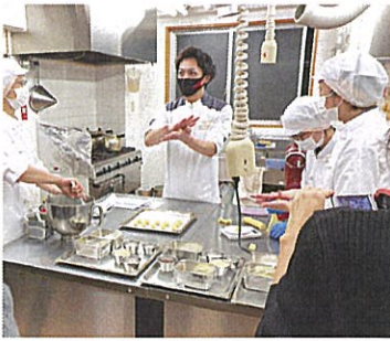
「パティスリーカメラ銀座」 中央区銀座7-5-12 ニューギンザ ビル8号館 JR山手線/新橋駅 徒歩4分 月～金 14:00～26:00 土 13:00～ 20:00 日曜: 祝日休み