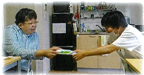
誕生会でバースデーカードをプレゼント！