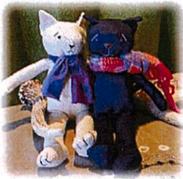
試作中のぬいぐるみ

通常業務の駐輪場清掃・マンション清掃・紙すき・受注品作成では、職員が指示する前から自主的に作業で使う道具の準備を行ってくれるようになったメンバーが居て、それを見た時には嬉しさのあまり涙が出そうになりました( ;∇;) 7月は通常業務の他にコインを使ったアクセサリー（外国から旅してきたコインを使っているので“旅するミサンガ”と命名）の制作をメインで行いました。皆で試行錯誤しながら腕用、足用、編み方やデザインの異なるものなど色々作っています。現在はカフェ大好きにて販売中ですが、他の販売先も開拓したいと思うこの頃です。8月は皆の特性を活かした工芸品を作りたいと思い色々なものを試作しています。その中でメンバーの意外な特技を発見する良い機会にもなっています。現在は3人の職員が一人一つずつ新商品の開発を行っており、キーホルダー・髪飾り・ぬいぐるみを試作中です。メンバーが作る事を基本に考えているので難しい部分も多いですが、商品化を目指してメンバー・職員一同で頑張っています。