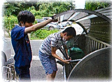
メンバー同士協力して作業の準備中