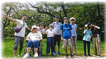
久しぶりの公園散策

屋内での余暇活動ではヨガやボール体操の他、太鼓の達人の動画を見ながらボールを叩くというのを思いつきでやってみたところ、皆さん思いのほか楽しんでくれました。音楽に合わせて体を動かすのは楽しいですね。感染爆発の影響で外出もままならないですが、今出来ることを最大限楽しんでいきたいと思えます。(上野)