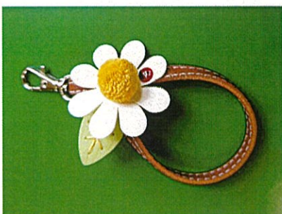
てんとう虫のキーホルダー

皆様のお宅で使わない布や着物などが眠って居りましたら譲っていただけると大変有り難いです。頂いたものはクラフト素材として大切に使用させていただきます。ご連絡お待ちしております！（上野）