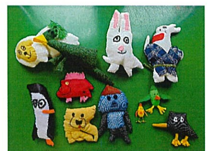
人形コレクション