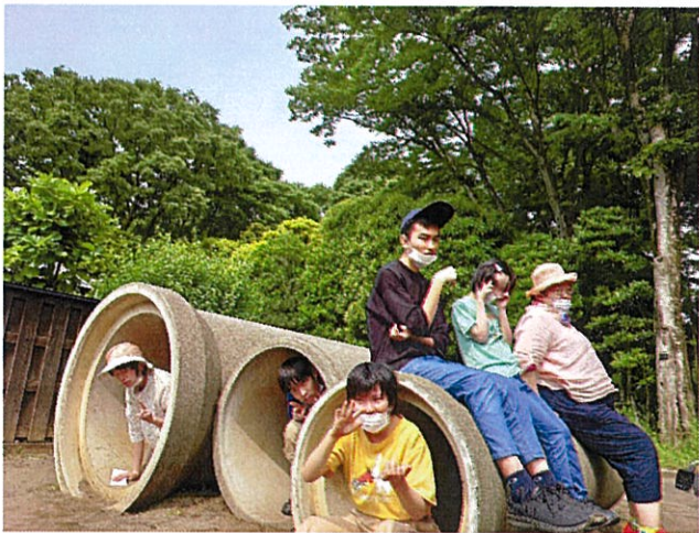
空地の土管でひと休み

コロナによる閉所や在宅支援から始まった新年度ですが、幸いなことにメンバーへの感染はなく皆さん元気に過ごされております。この2ヶ月は梅雨入り前に気持ちいい天気の中でなるべく多く自然を感じられるように外出のプログラムを増やしました。小金井公園にある江戸たてももの園は皆が楽しんでくれて半日では時間が足りなかったので2度に分けて訪問しました。メンバーから園内にある食事処で食事をしたいとのリクエストもあったので、1日遠足の計画も立てたいと思います。国領探検をしながらのお散歩では歩行訓練するメンバーを歌で応援するメンバーも居て和やかな時間となっております。自然を感じることはモノ作りの感性を養うことにも繋がると思うので、これからも暑さ寒さに負けず探検を続けていきたいと思ひます。(上野)