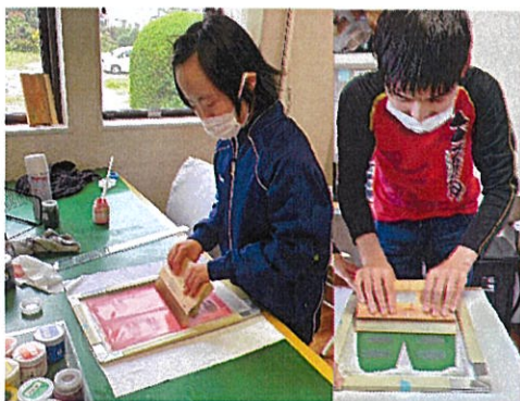
意外と難しいプリント作業