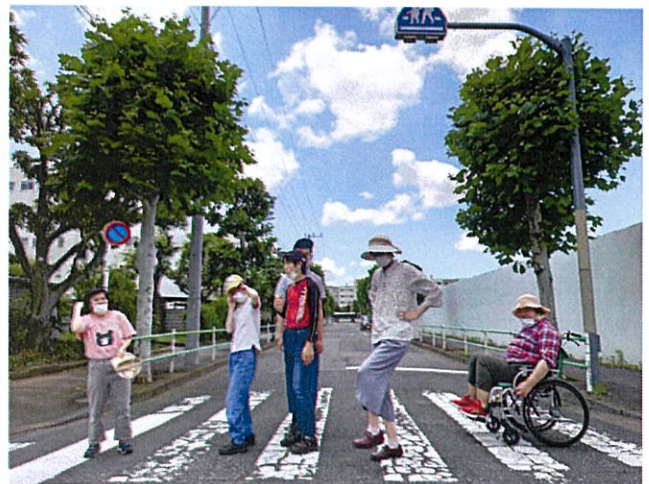
ビートルズっぽく...