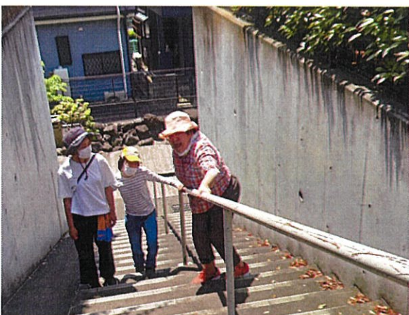
階段の手すりを使ってトレーニング