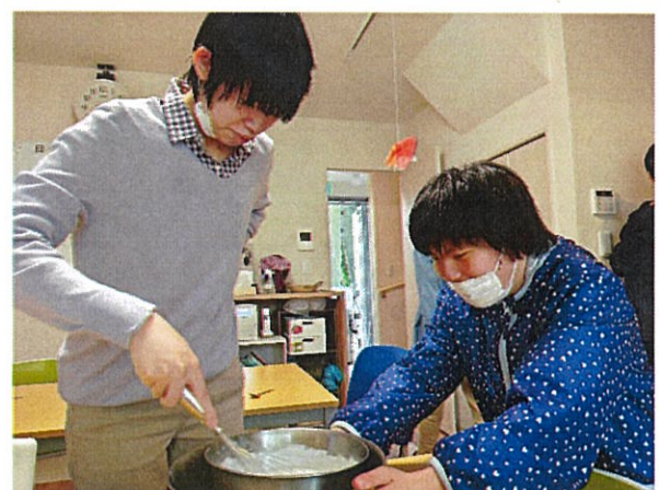
誕生日のケーキ作り♪

車いすを利用しているメンバーも手すりを使って歩く練習と筋力トレーニングに励んでいます。PTの勧めにより職員が乗った車いすを本人が押しながら歩くという訓練もしており、ペースはゆっくりですがこの数カ月のチャレンジでみるみるスピードアップしています。6月、7月、8月と誕生日を迎えたメンバーが居たので、月ごとに誕生日をお祝いしてお菓子作りも楽しみました！みんな甘いもの大好きです！