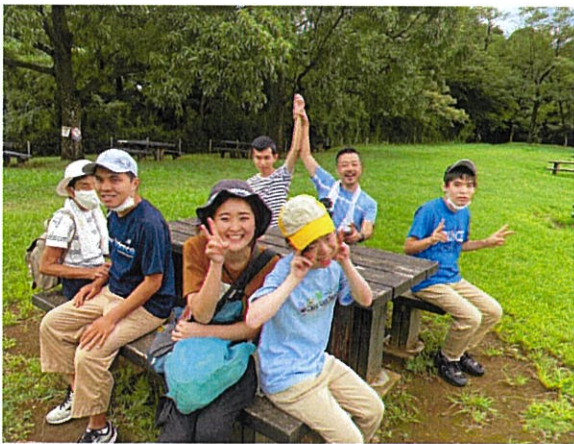
公園の展望台にて

創造農園さんのカフェ“空と大地と”に納品しているミサンガがお客様の間で流行っているらしく、購入して頂いたお客様から商品を追加納品してほしいと直接お電話を2度も頂きました。オリジナル手ぬぐいも売れ行きが好調で生産が追いついておらず嬉しい悲鳴が出そうですが、1年前には考えられなかったこの状況にメンバーと共に頑張ってきた日々を思い返すと感慨深いものがあります。自主製品の増産に努力しつつも色々な公園へ行って運動したり、ケーキを作って誕生日のメンバーを祝ったりと心のゆとりと豊かさを感じられるような活動も減らすことなく楽しんでおります。皆で芝生に寝転がり空を眺めていると歌い出すメンバーや静かに笑っているメンバー、みんなと一緒に過ごしている空間に幸せを感じて涙ぐむことの増えたオジサン（私）が一人。みんなのやさしさに感動と感謝の日々です。感染症による息苦しい日々は続いていますが、この病や暑さにも負けずに毎日を楽しんでいきたいと思っております。(上野)