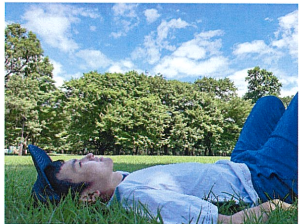
大地に寝転び空を眺める