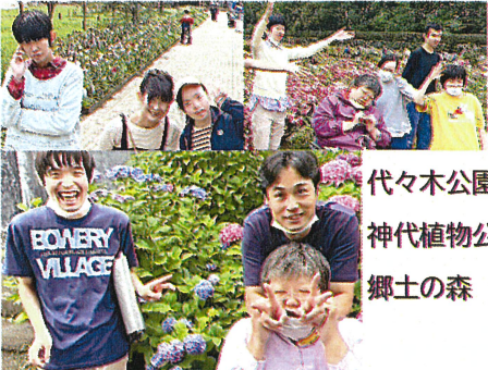
代々木公園 神代植物公園 郷土の森